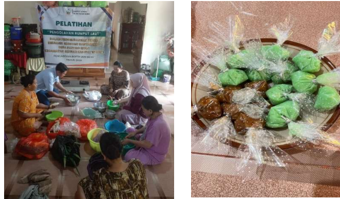
Gambar 4. Dokumentasi Kegiatan Pengolahan Rumput Laut