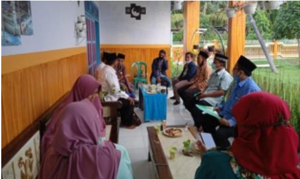
Gambar1. Diskusi dan Sosialisasi Penggunaan Aplikasi