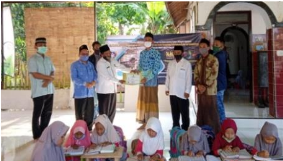
Gambar2. Penyerahan Sertifikat Pelatihan