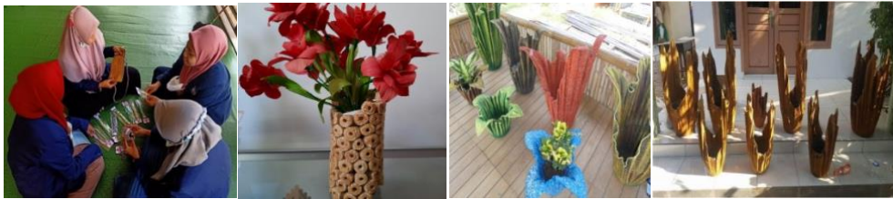
Gambar 1. Produk Keterampilan mahasantri

Beberapa produk yang dibuat oleh Mahasantri diantaranya ; pot bunga dari bahan daur ulang handuk bekas, Pot Bunga dari bahan jangel jagung, pada gambar 1.