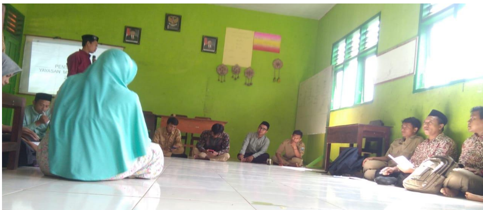
Gambar 3. FGD Penyampaian Jadwal dan Keputusan Pendampingan bersama Kepala SDI Miftahul Ulum Pakuniran dan Staf di SDI Miftahul Ulum.