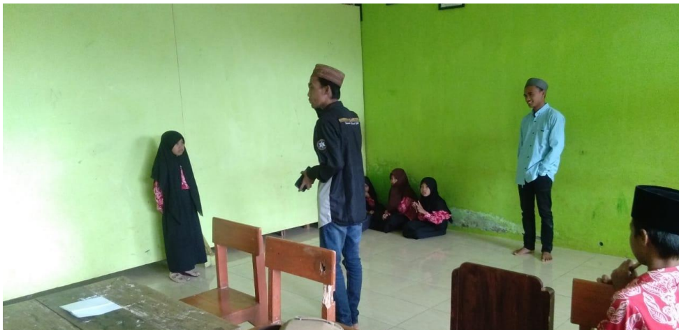
Gambar 4. Strategi dalam Pendampingan Pengembangan Bakat Siswa SDI Miftahul Ulum.

Kegiatan pendampingan ini disaksikan oleh seluruh siswa berbakat yang telah terseleksi sebelumnya. Penyempurnaan tata cara tidak hanya diterima oleh 1 siswa langsung, namun juga oleh semua siswa sehingga penyampaian cukup efektif dan efisien dalam pengembangan bakat siswa dalam berpidato. Hal tersebut pun juga di-observasi oleh salah satu tim pengabdian yang lain secara partisipan. Berbagai masukan penyempurnakan diterima oleh siswa dengan baik tanpa mengurangi gaya-gaya pada setiap siswa yang didampingi.