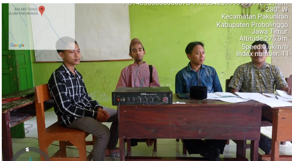
Gambar 2. Rapat Penentuan Jadwal Kerja Tim Pengabdian Masyarakat Bersama Kepala SDI Miftahul Ulum Pakuniran dan Staf.