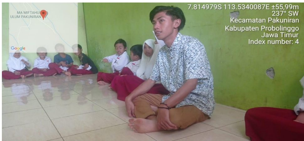
Gambar 5. Strategi Kekeluargaan dalam Pendampingan Pengembangan Bakat Siswa SDI Miftahul Ulum.

Strategi ini tepatnya adalah dengan cara duduk lesehan di mana 1 siswa berbakat tampil berpidato sedangkan siswa lainnya adalah memperhatikan dan menyimak dengan seksama. Mereka terlibat dalam penyempurnaan juga sehingga merasa ada wewenang bagi dirinya dalam memperbaiki teman atau dirinya sendiri dalam berpidato. Targetnya adalah tercipta kemandirian pada diri setiap siswa yang sedang berada dalam pendampingan pengembangan bakat di SDI Miftahul Ulum.