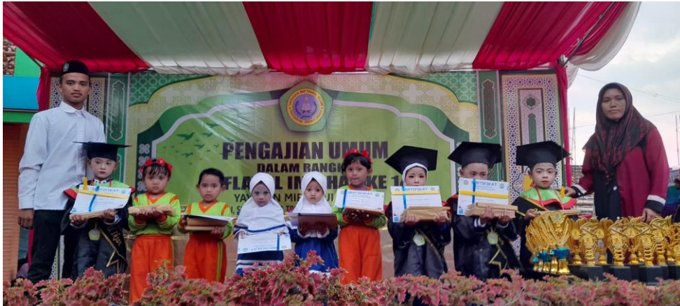
Gambar 6. Promosi Hasil Pendampingan Pengembangan Bakat Siswa SDI Miftahul Ulum.