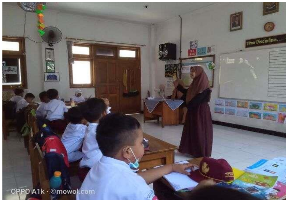
Gambar 4. Pendampingan pembelajaran siswa