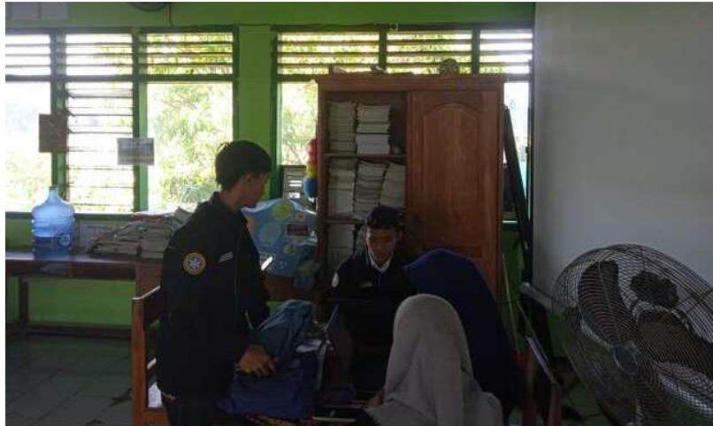
Gambar 5. Mencari literasi dan diskusi