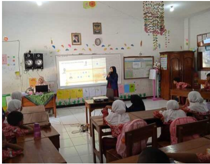
Gambar 6. Presentasi di kelas 1