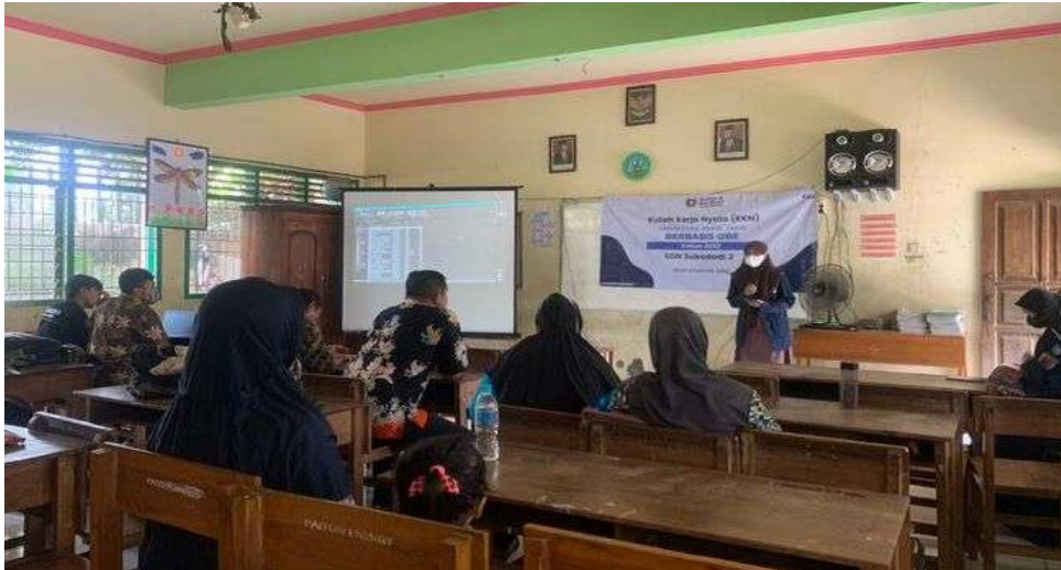
Gambar 9. Evaluasi

masih ada beberapa siswa yang perlu diberi pemahaman lebih banyak lagi terkait kebiasaan tersebut.