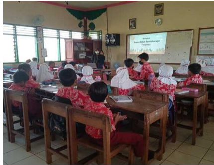
Gambar 7. Presentasi di kelas 4