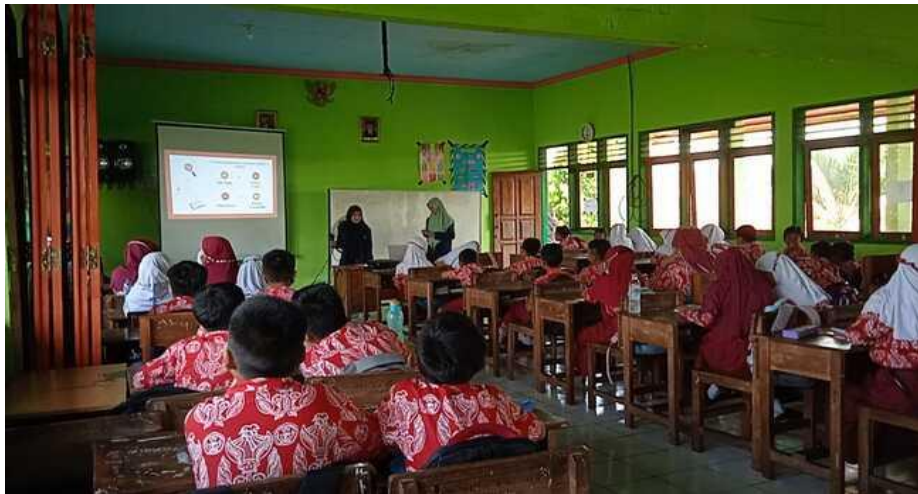
Gambar 8. Presentasi di kelas 5