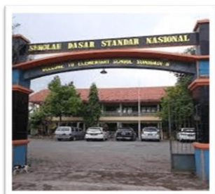
Gambar 1. Gapura Sekolah

Lokasi mitra yang berlangsung kami lakukan yaitu di SDN Sukodadi 2 yang terletak di Jl. Pakuniran, Desa Sukodadi, Kecamatan Paiton, Probolinggo. SDN Sukodadi 2 ini didirikan pada tahun 1986. Sekolah ini memiliki 225 orang peserta didik dengan rincian 127 orang laki-laki dan 98 orang perempuan. Jumlah guru ada 17 orang terdiri dari 1 orang kepala sekolah dan 16 orang guru. Memiliki jumlah rombongan belajar sebanyak 11 ruang. Letak sekolah ini cukup strategis karena dapat dijangkau dengan kendaraan apapun.