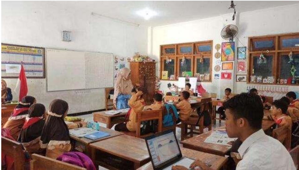
Gambar 3. Proses membuat video pembelajaran

belum memiliki pengetahuan yang memadai, mengenai perangkat pembelajaran berbasis digital dan bagaimana cara membuat menggunakan serta penerapannya dalam pembelajaran (Faisal, 2020).