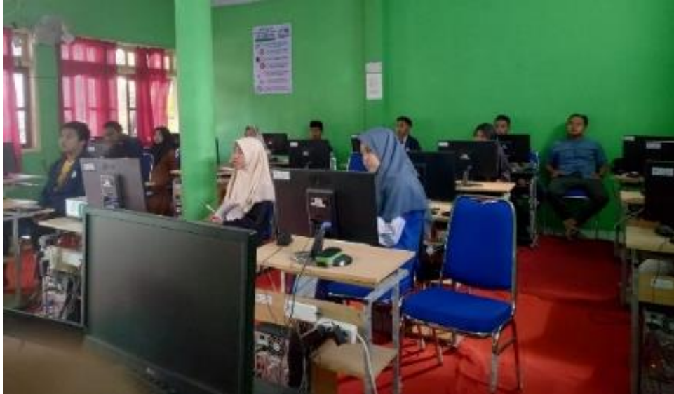
Gambar 1. Peserta pelatihan pembuatan video promosi al-fadholi

untuk membuat sebuah tampilan video promosi sederhana, yang dapat menyampaikan materi yang di presentasikan dengan tepat.